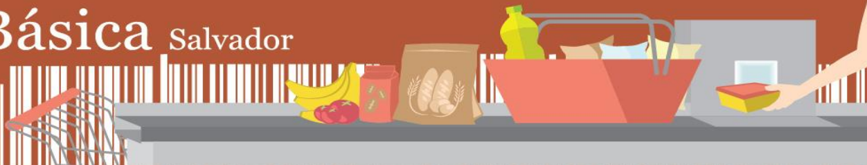
Gráfico 2 Participação do custo da Cesta Básica de Salvador no salário mínimo (1) – Set. 2024