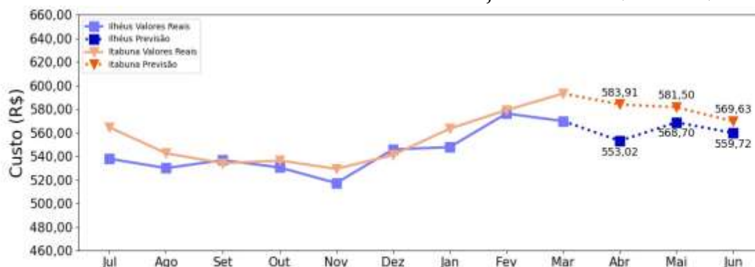
Figura 3 – Previsão 1 do custo total da cesta básica até junho de 2024, Itabuna, Bahia

Para os próximos três meses (Figura 3), a expectativa é de redução no custo da cesta básica até junho de 2024.