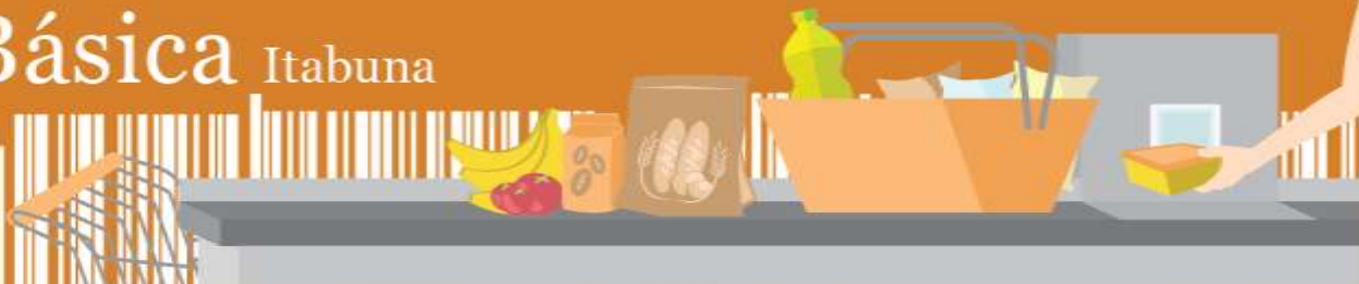
Figura 2 – Comprometimento do salário mínimo em relação ao custo da cesta básica (em %), março de 2024, Itabuna, Bahia